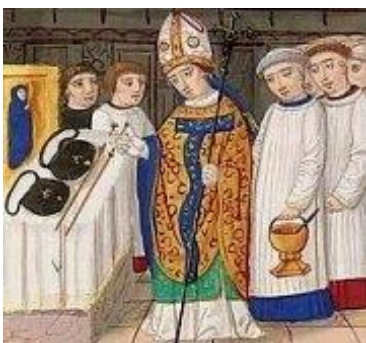
Bénédictio du pèlerin

En début d'après-midi, nous visiterons ce haut lieu de mémoire et d'histoire qu'est l'Espace Culturel du Christianisme à Lyon, à l'Antiquaille, sa crypte décorée de mosaïques, et le « cachot » de saint Pothin.