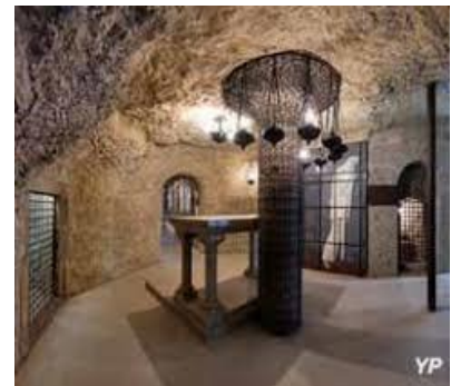
Cachot de saint Pothin